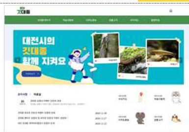
대전깃대중 브랜딩 www.대전깃대중.kr