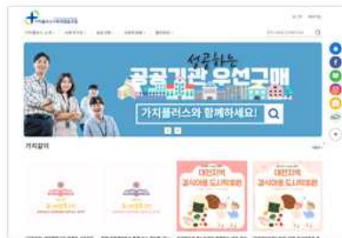
공공구매 플랫폼 가치플러스 www.value-plus.kr