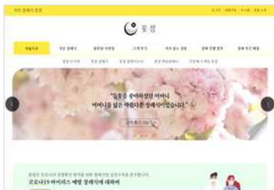
장례고객관리 시스템 꽃잠 www.ggotjam.com