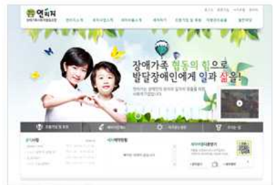
세차관리 시스템 연리지 www.yeonliji.com