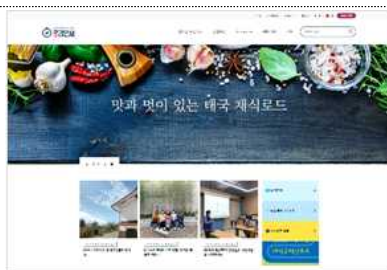
여행예약 시스템 공감만세 www.fairtravelkorea.com